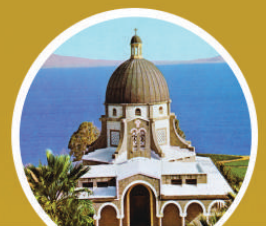
CHURCH OF BEATITUDES