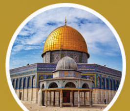
DOME OF THE ROCK

Pagi hari Peserta Tour menuju Bukit Moria , untuk mengunjungi Dome of The Rock dan melewati Gerbang Emas , serta masuk ke Kota Tua Yerusalem (Old Jerusalem) untuk mengunjungi Gereja St. Anna & Kolam Bethesda tempat Tuhan Yesus menyembuhkan orang sakit pada hari Sabat (Yohanes 5:7-9); VIA DOLOROSA (Jalan Salib) sampai ke Bukit Golgotha tempat Tuhan Yesus disalibkan dan ke Holy Sepulchre (Makam Kudus) ; Menuju Bukit Sion di Yerusalem untuk mengunjungi St. Peter in Gallicantu (Gereja Ayam Berkokok), tempat Tuhan Yesus di penjarakan (Matius 26:34), serta mengunjungi Last Supper Room (Ruang Perjamuan Terakhir) dan David Tomb ; Sore hari, menuju ke Tembok Ratapan (Wailing Wall) tempat paling suci bagi orang Yahudi. Bermalam di Jerusalem/Bethlehem.(B, L, D)