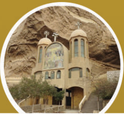
ST. SIMON THE TANNER