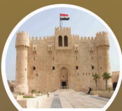
CITADEL OF QAITBAY