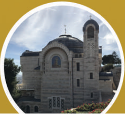
ST. PETER GALICANTU