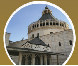
CHURCH OF ANNUNCIATION

Pagi hari Peserta Tour menuju perbatasan Taba Border (Perbatasan Mesir & Israel) untuk melewati proses imigrasi; Dalam perjalanan, akan melewati Patung Istri Lot (Kejadian 19:17); Dilanjutkan menuju ke QUMRAN untuk melihat gua-gua tempat salinan gulungan Kitab Suci ditemukan; Menuju Laut Mati (Dead Sea) untuk berenang terapung; Dan menuju Jericho, untuk melihat Bukit Pencobaan (Matius 4:1) dan Pohon Ara Zacheus (Zacheus Pemungut Cukai bertemu Yesus); Bermalam Jerusalem/Bethlehem.(B, L, D)